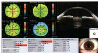
CICS:術前IOLスクリーニング