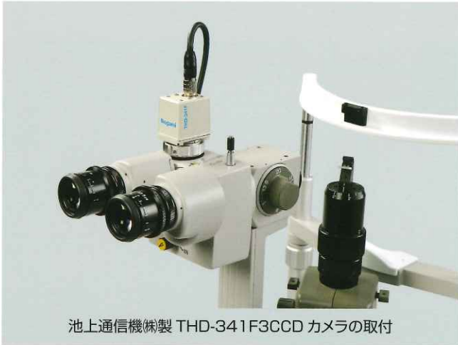
池上通信機(株)製 THD-341F3CCD カメラの取付

※ 但し、本コンビネーションアダプターでは1/3インチ素子のCCDカメラの取付によりモニター上で最適な画角を得ることができるように設計されています。